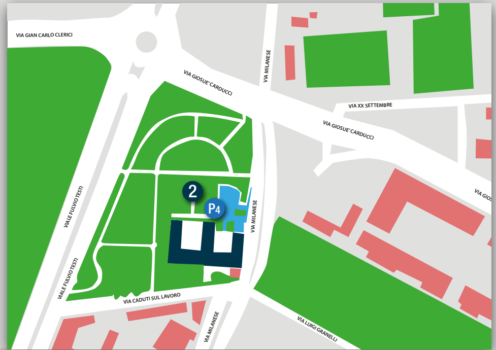
SESTO SAN GIOVANNI